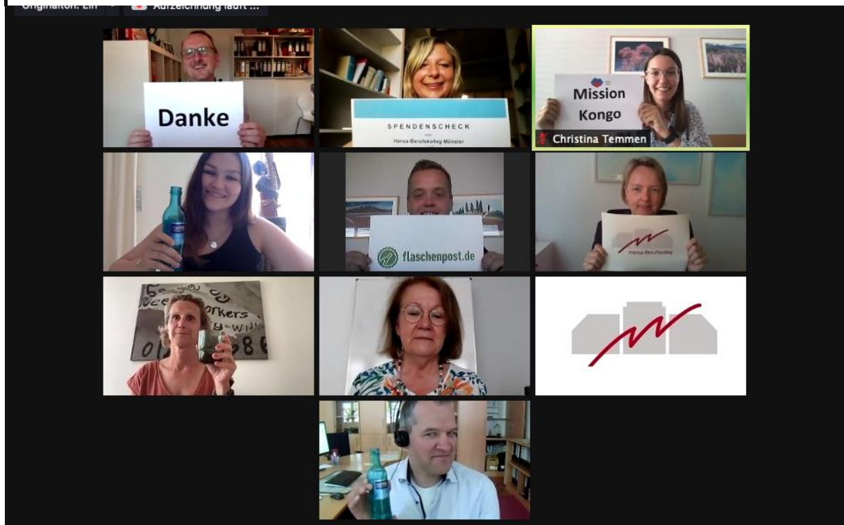
Abbildung 3: Bildschirmabzug der Spendenübergabe.