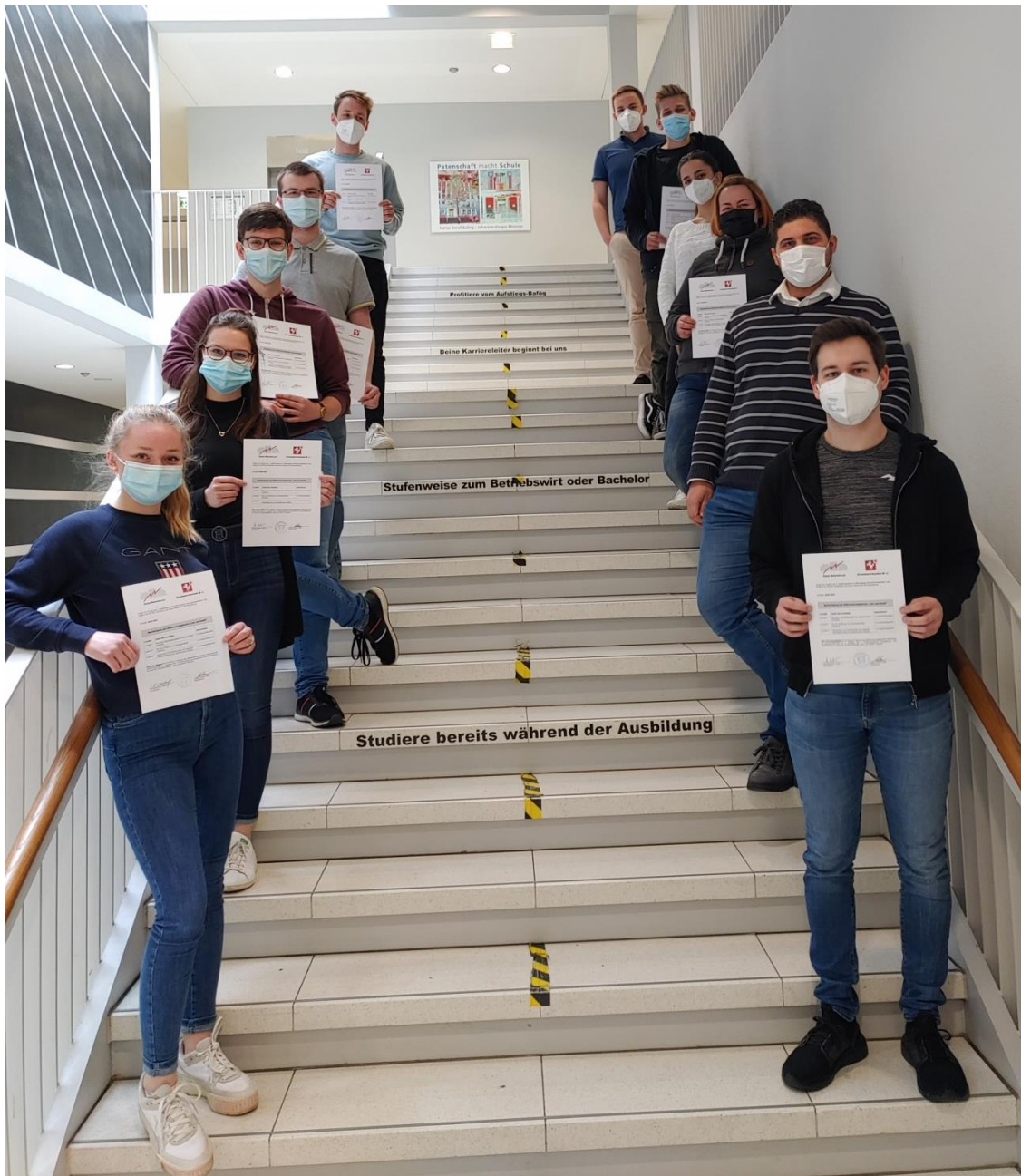
Abbildung 2: Schüler*innen der ST19 B mit den Zertifikaten.