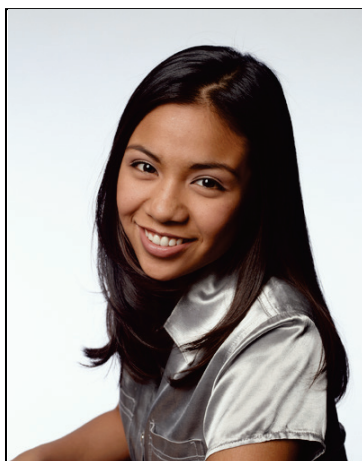
Claudia Kaiser Schloßstraße 2 97450 Arnstein